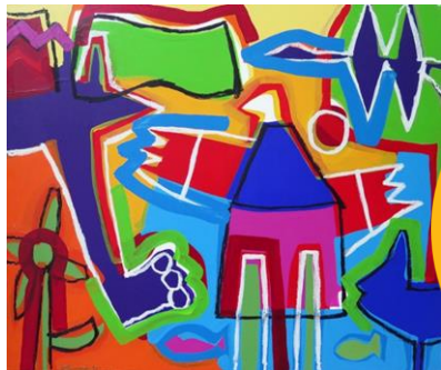
João Paramés, Um jardim perfeito